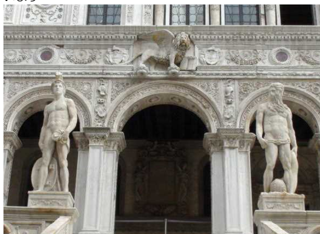
デューカーレ宮殿を出ます