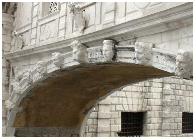
ため息橋の下に顔の彫刻があります

デューカーレ宮殿の中にも、見て載きたいものが山ほどありますが、割愛して「ため息橋」を渡って牢獄に行きます。