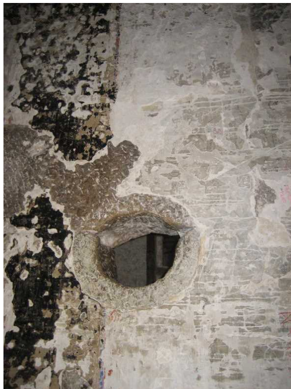
掌の大きさ 出し入れの穴