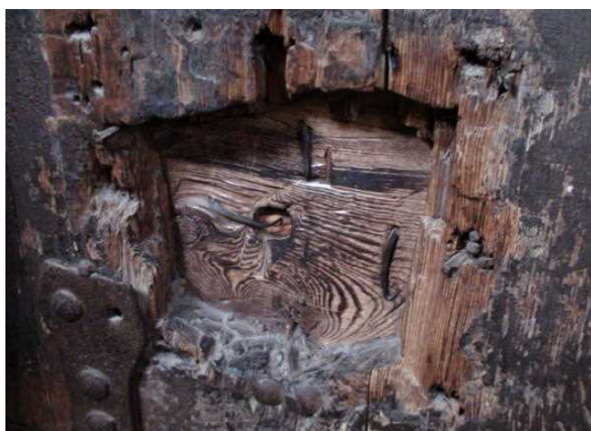
牢獄の食事を入れる扉