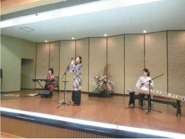
アトラクション 和楽