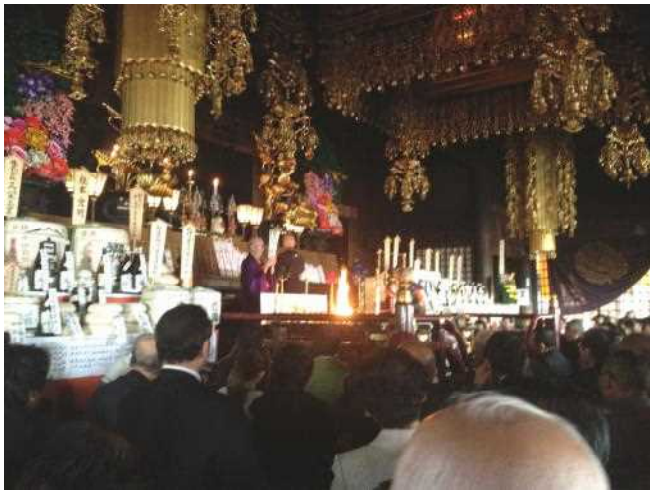
犬山成田山 ご祈祷