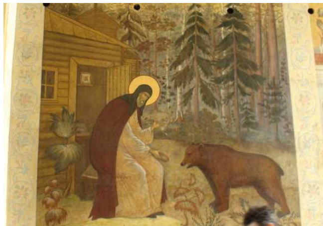
聖人セルギエフの絵