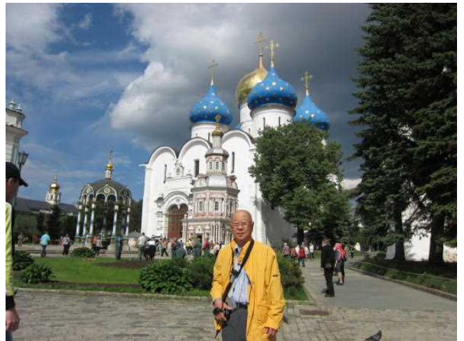
ウスペンスキー大聖堂