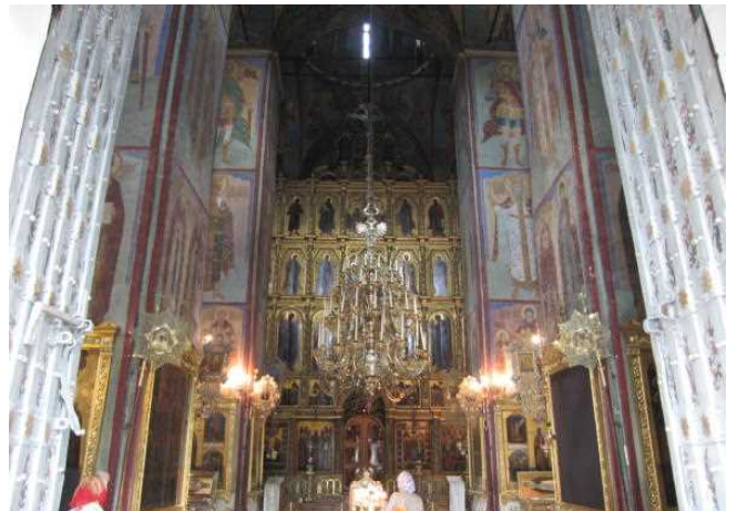
ウスペンスキー大聖堂の内部