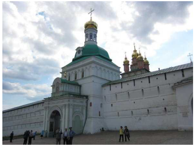
トロイツェ・セルギエフ大修道院入り口

大修道院の中には沢山の教会や塔があってガイドの説明も届きません。帰りの集合時間だけは伝わりました。