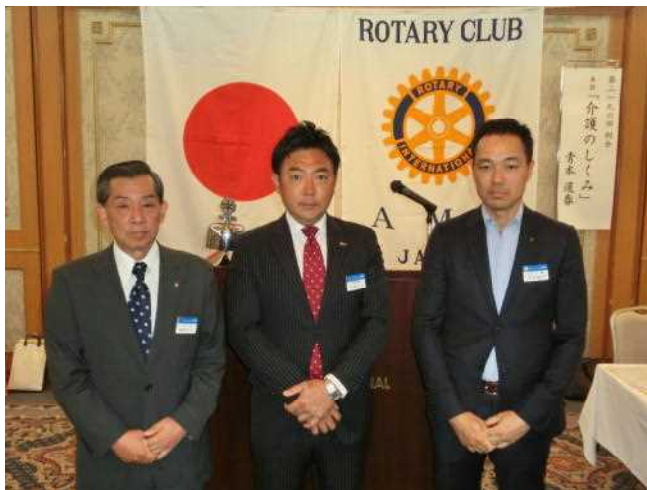
蟹江学戸ホテルの会へ助成金進呈