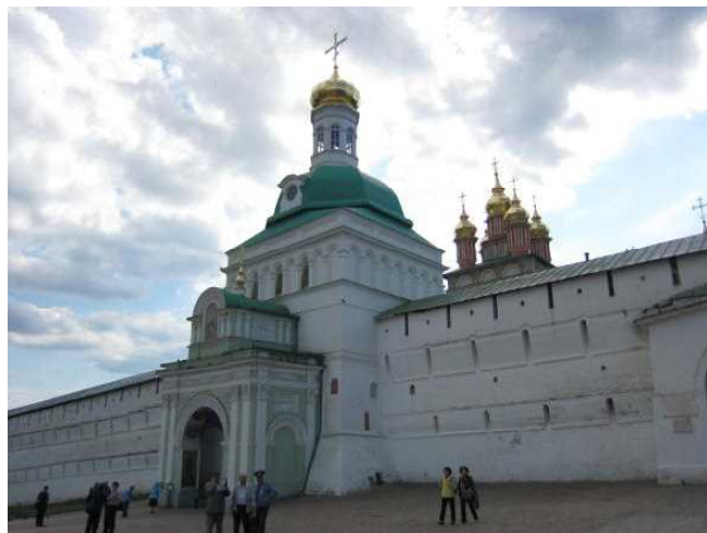
トロイツェ・セルギエフ大修道院入り口

大修道院の中には沢山の教会や塔があってガイドの説明も届きません。帰りの集合時間だけは伝わりました。