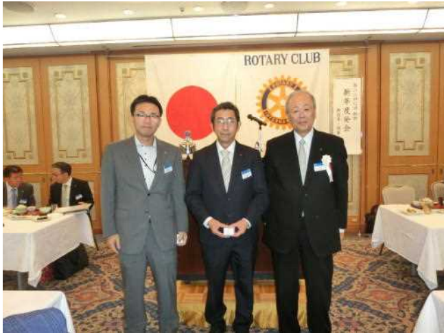
前会長・幹事に記念バッジ贈呈