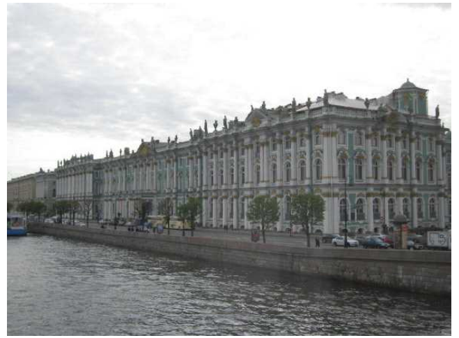
エルミターージュ美術館

次に訪れたのは血の上の大聖堂です。血の上の大聖堂はモスクワの聖ワシリイ寺院に似た建築様式です。アレクサンドル2世が1881年に暗殺されました。アレクサンドル3世が、その血の上に聖堂を建てました。悲劇的なテーマとは裏腹に、その外観はきらびやかな印象を受けます。