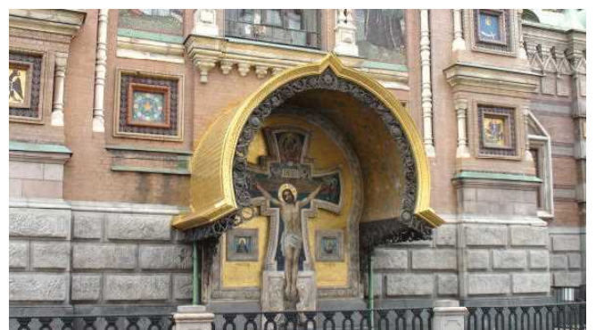
血の上の大聖堂（側面）