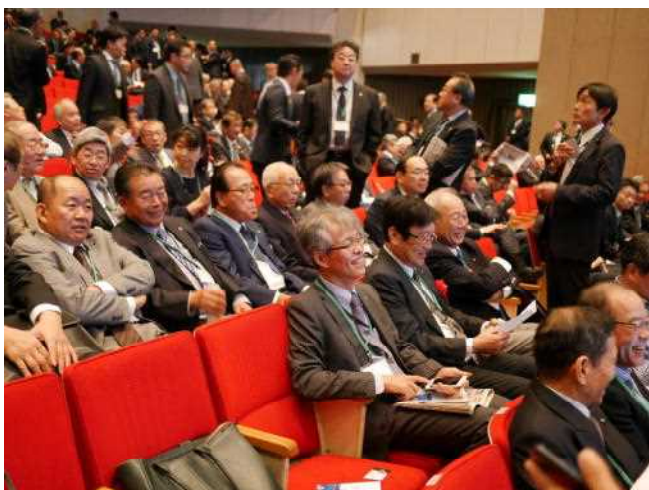
あまRC参加メンバー