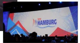
◆ポリオ撲滅！女性会員30%！若い会員の増強！