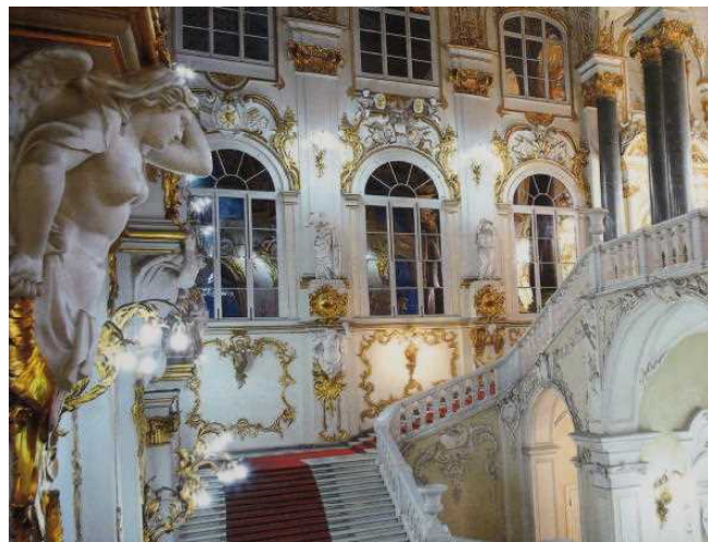
空いている大使の階段

私たちのツアーの方々は、館内のカフェやレストランで食事をしています。他の観光客も食事中です。美術館では入場制限をするので、大使の階段は観光客で超満員となります。私たちはその辺りの事情を推察して、大使の階段がすいている間に写真やビデオを撮りました。昼食は集合時間までに済ませれば良いのですから。