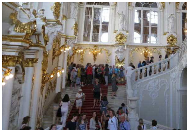
昼食が終わるとこの混雑です