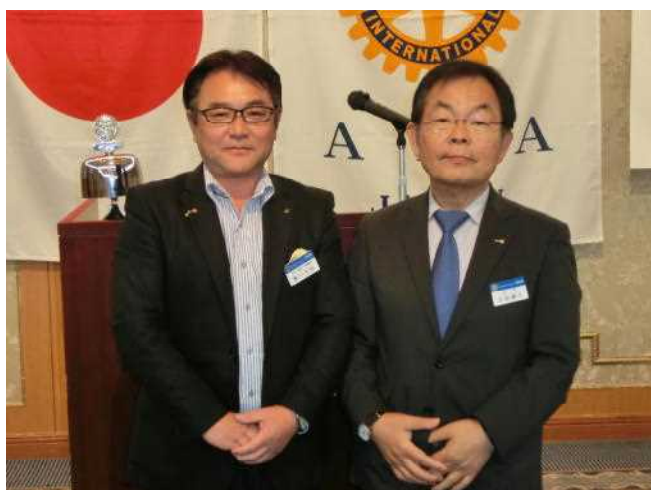
前会長・幹事に記念バッジ贈呈