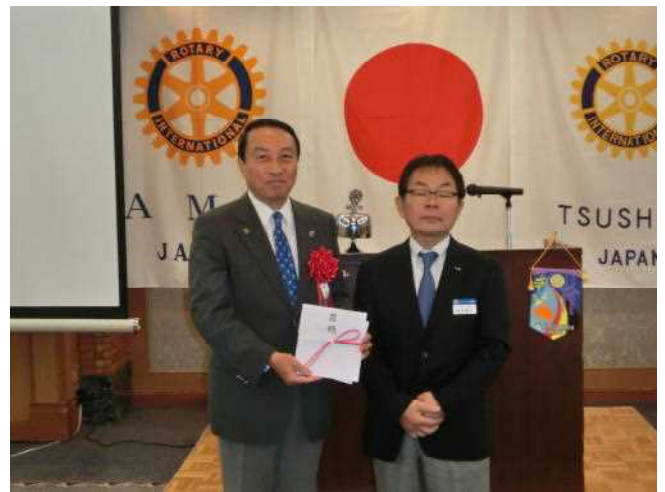
ロータリー財団・米山記念奨学会へ寄付目録贈呈