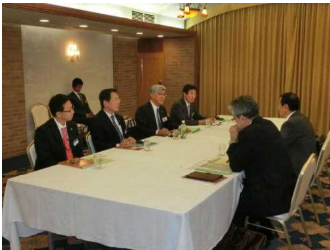
神野ガバナーを囲んで懇談会