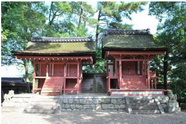
富吉建速神社本殿・八剱社本殿

向かって右側にある富吉建速神社（とみよしだけはやしんしゃ）は一間社流造檜皮葺（ひわだぶき）、向かって左側にある八剱社（はちけんしゃ）は三間社流見世棚造檜皮葺（さんげんしゃながれみせだなづくりひわだぶき）。それぞれの祭神は素戔鳴尊（すさのおのみこと）と熱田五神である。ともに室町時代後期の建築とされ、前流れの美しい屋根の曲線と桃山時代への推移を示す臺股（かえるまた）は特に優れている。なお、国の重要無形民俗文化財である須成祭は、当神社の大祭として行われるものである。