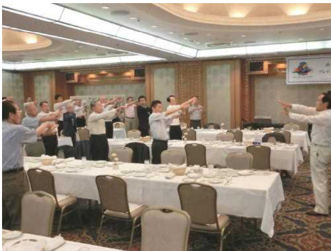
例会前のストレッチ体操