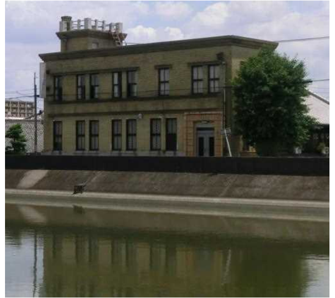
甘強味淋旧本社事務所

昭和12年（1937）竣工、蟹江町で最初の鉄筋コンクリート造建築である。外壁は当時よく普及した引っかけ傷をつけて焼かれたスクラッチタイルで覆われている。立地は蟹江川の堤防に接して建ち、川側に正面入り口が設けられており、蟹江川の水運を利用して原材料や製品の運搬をしていたことがうかがえる。登録名称は甘強味淋旧本社事務所となっているが、今は現役の甘強酒造本社事務所として再び活用されている。