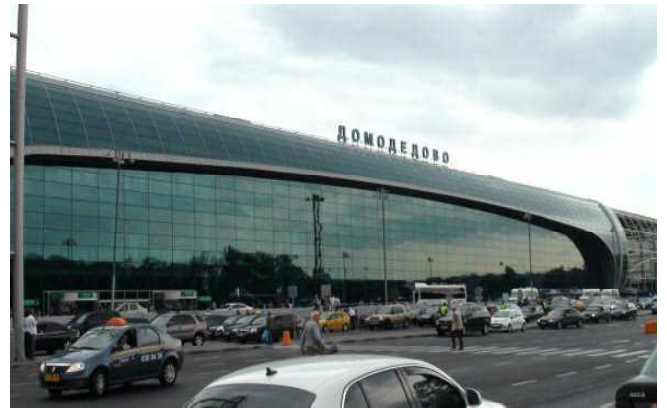
モスクワのドモジェドボ空港

モスクワのドモジェドボ空港には午後4時到着です。ここからバスでスーズダリに行き、ホテルに入ります。7年前はそれほどでもなかったが、現在はロシアの経済が発達して車が随分増加しました。道路は広いが渋滞に次ぐ渋滞で220kmの行程に5時間も要しました。途中から田舎道になり、道路もガタガタです。ホテルに到着したのが午後10時で、白夜のためやっとなり薄暗くなりました。