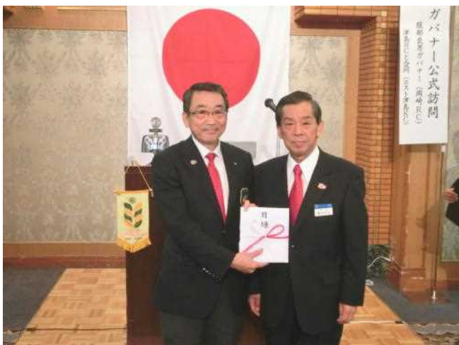
ロータリー財団・米山記念奨学会へ寄付目録贈呈