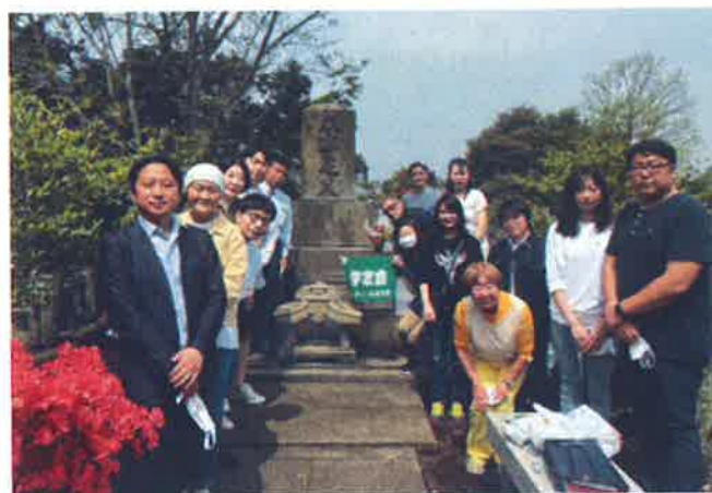
ハイライトよねやま Vol.266より

関東にある4学友会会長と学友が4月23日、今米山梅吉翁の墓参のため、横浜市鶴見区の総持寺を訪れました。この合同墓参は2018年に第2580地区（東京都・沖縄県）と第2590地区（神奈川県横浜市・川崎市）が始めたもので、その後、コロナ禍のため中断。今年再開するにあたって近隣地区にも声を掛け、上記2学友会の会長・学友・奨学生に加えて、第2750地区（東京都）・第2780地区（横浜市・川崎市を除く神奈川県）の各学友会会長、第2590地区米山委員2人の計15人が参加し、墓所の清掃と供花、総持寺内の見学をしました。今回は初めて4学友会の会長が揃って梅吉翁の墓参をしたということで、それぞれがこの奨学事業の始まりに思いをはせ、後の学友会を活発にしたいという気持ちを新たにされた様子でした。