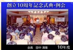
10周年記念式典・例会