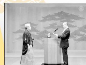
35周年記念式典(名古屋能楽堂にて)