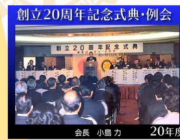
20周年記念式典・例会