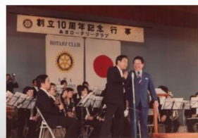
10周年記念行事(ミニオーケストラ)