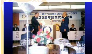
25周年記念式典・祝宴