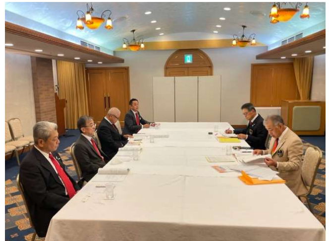
酒井法丈ガバナーを囲んで懇談会