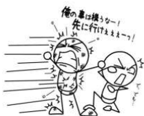
持続不可能な奉仕は・・・