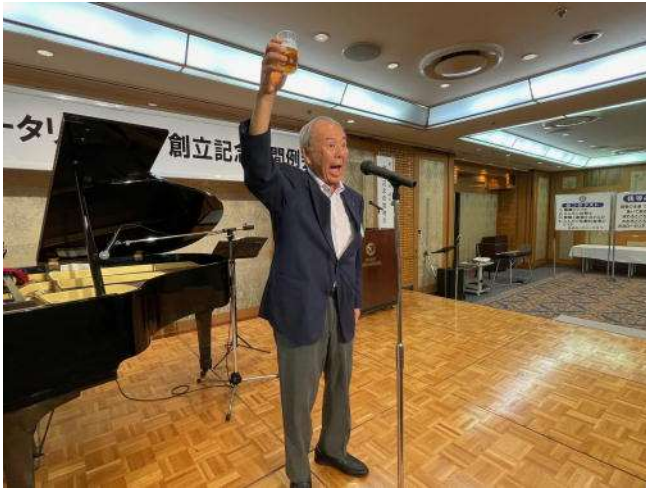
乾杯の発声は大竹君