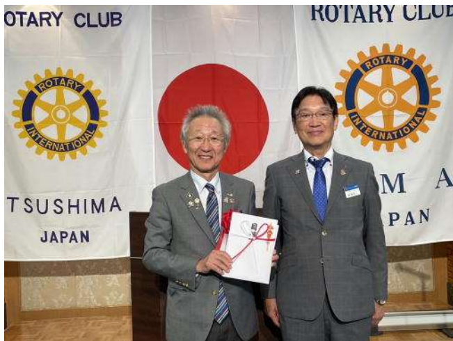
R財団・米山記念奨学会へ寄付金目録贈呈