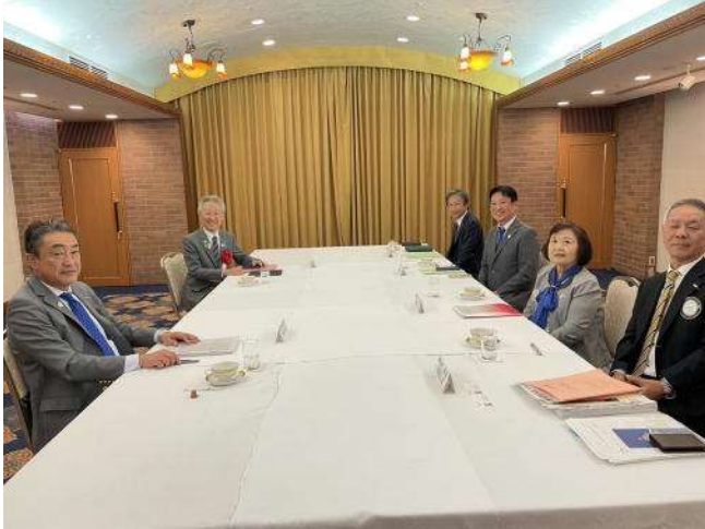
吉川公章ガバナーを囲んで懇談会