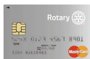
マスターカード スタンダード（個人）

また、ロータリーカードについても、多くの皆様にご入会いただきたいと思います。利用額の一部が自動的に寄付となりますので、例えば IDM や、食事、ゴルフ等の支払いにぜひロータリーカードをご利用ください。キャッシュレス化の時代ですので、新たな寄付の形としてご活用をしていただければと思います。